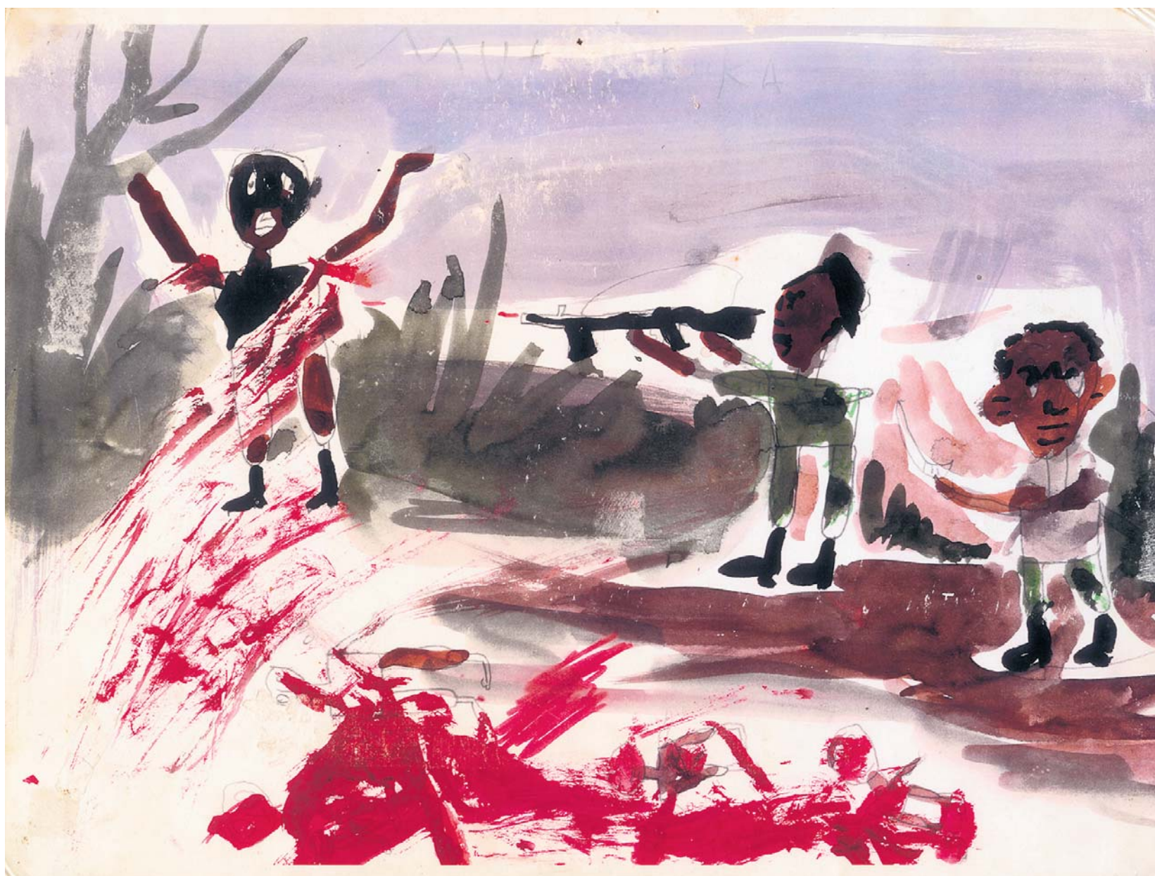
Rwanda, dessin d'enfant sur le génocide, 1997.

J'ai aimé ces gamins comme s'ils avaient été les miens. J'ai gardé ancrée au plus profond de mes souvenirs leur souffrance, dont je n'ai partagé qu'une pâle résurgence timide durant cette brève intimité de multiples et inutiles massacres. Jamais je ne les oublierai ni n'oublierai ce qu'ils ont vécu. Jamais je